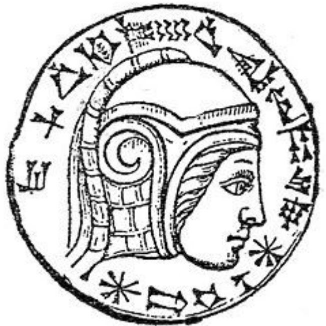
Pečat u oku Mardukovog kipa u Babilonu, koji se često tumači kao prikaz Nabukodonosora II.

Nabukodonosor II. je bio drugi sin Nabopolasara, babilonskog kralja koji je Babiloniju oslobodio od asirskog ropstva, a 612. pr. Kr. uništio Novoasirsko Carstvo u savezu s medijskim kraljem Kijaksarom. Kako bi se taj savez učvrstio, Nabukodonosor II. se oženio za medijsku princezu Amitis od Medije.